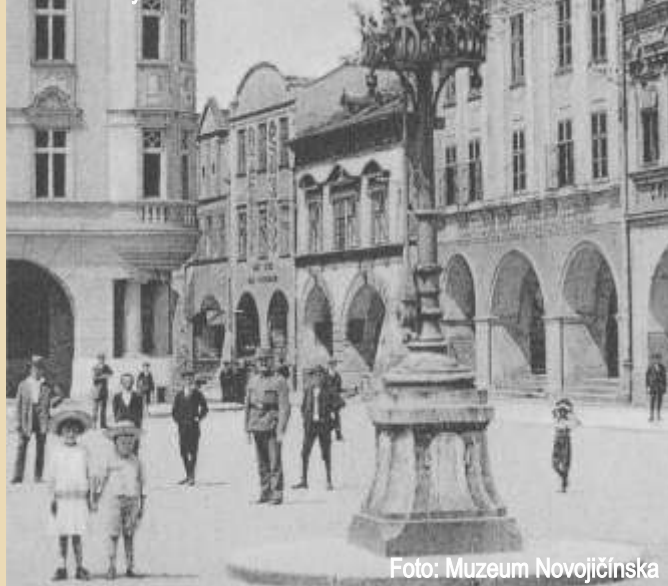
Dům rodiny Baarů v roce 1900.