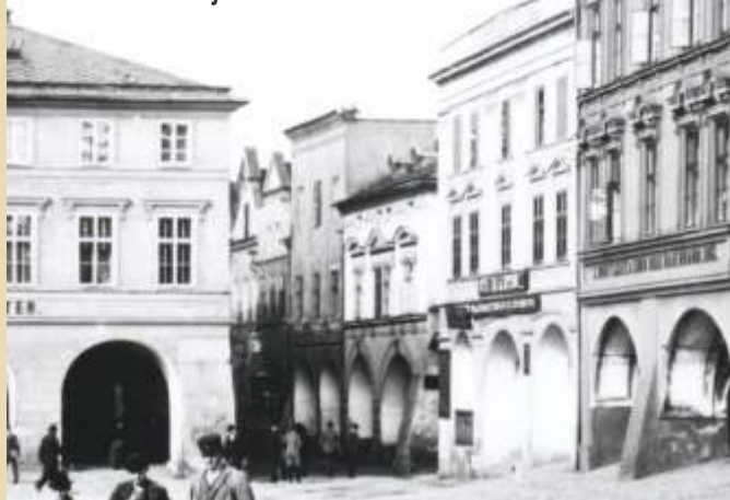
Uliční fronta tehdejší Schwarzstrasse z roku 1895.